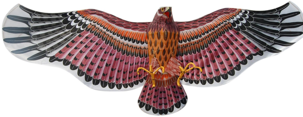
Assembled Kite (Front View)