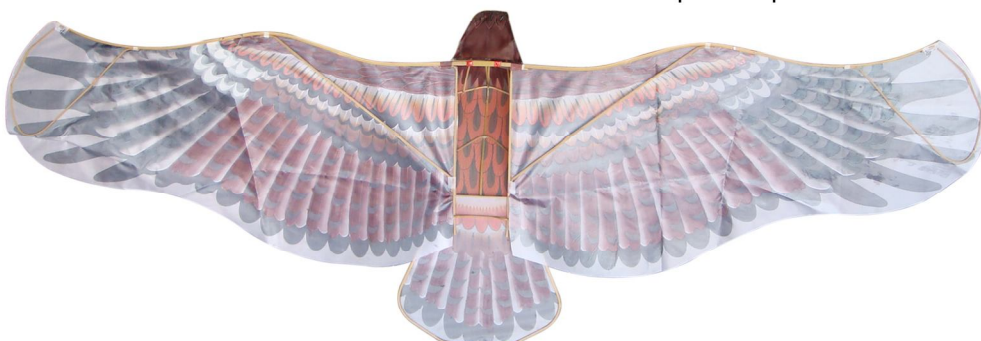
Assembled Kite(back view)